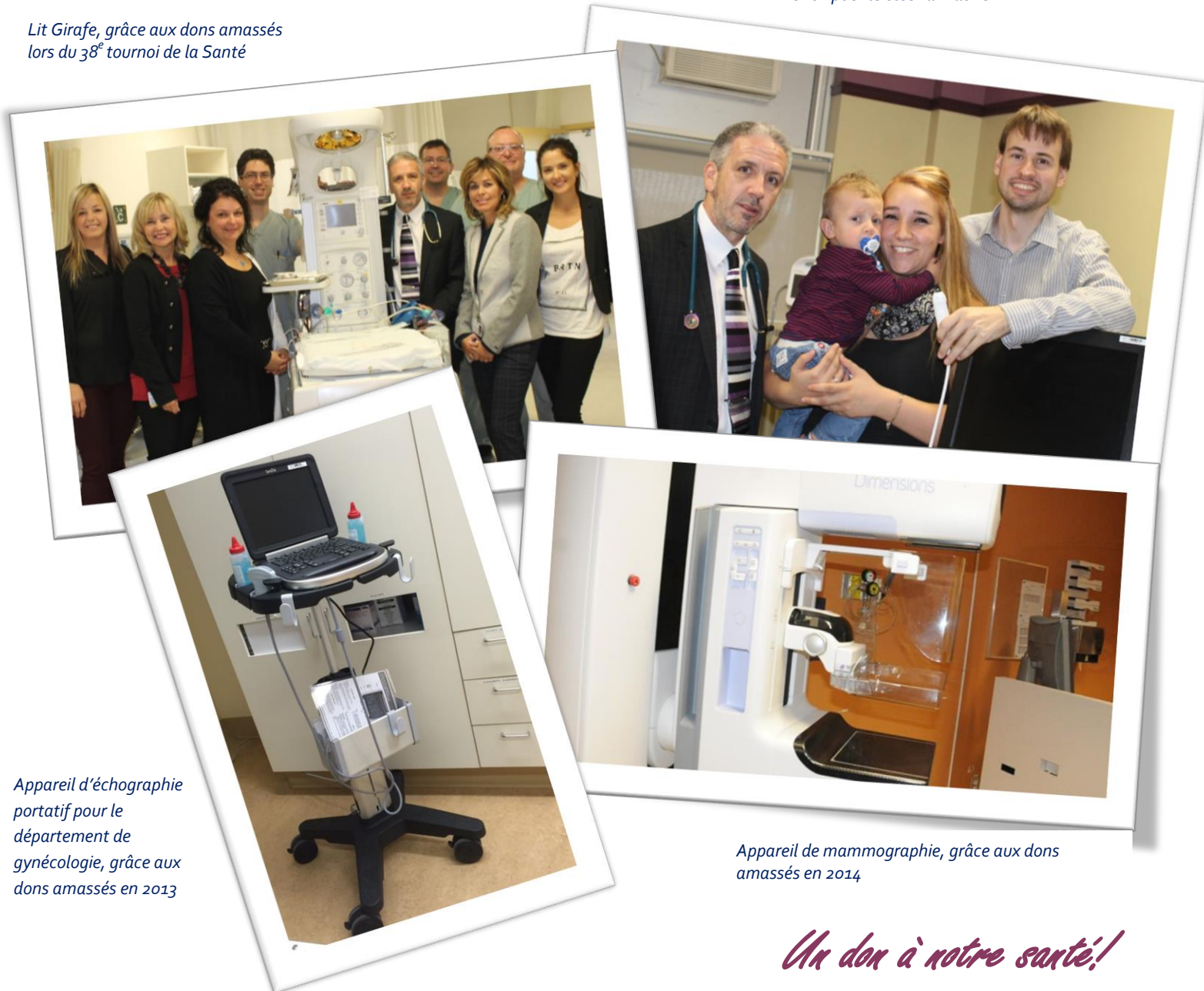
Appareil d'échographie portatif pour le département de gynécologie, grâce aux dons amassés en 2013

Lit Girafe, grâce aux dons amassés lors du 38 e tournoi de la Santé